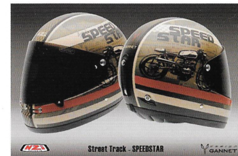
Street Track - SPEEDSTAR